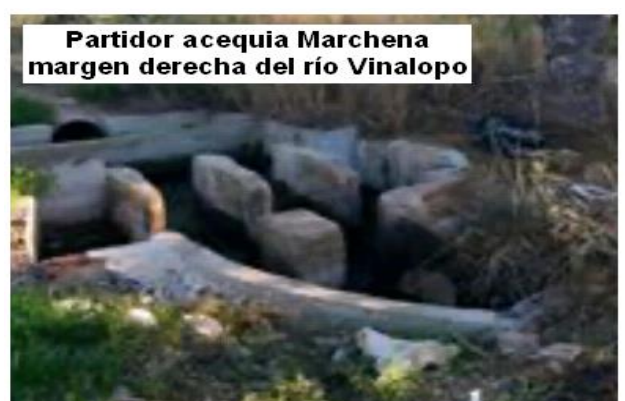
Partidor acequia Marchena margen derecha del río Vinalopo

nuevamente al Primer Canal de Riegos de Levante y tras cruzar los caminos de la Piedra Escrita y los Torres, descenderemos por el Barrancón hasta llegar a la Ermita del Santo Angel de la Guarda, punto de confluencia de las populosas partidas de Algoda y Puçol y en las que ya los que tenemos más de 18 años, tan entrañables recuerdos guardamos de sus