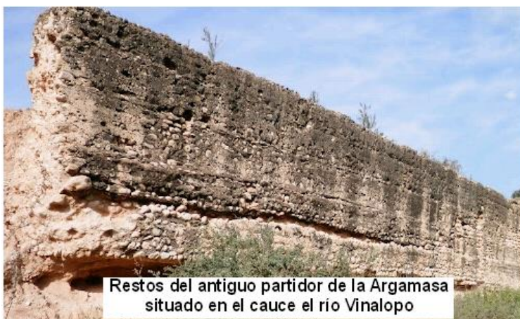
Restos del antiguo partidor de la Argamasa situado en el cauce el río Vinalopo

de los más auténticos de nuestro “Camp d’Elx” mostrándonos el tipo de distribución de las parcelas ya desde la época árabe, en los laterales, por donde corren las acequias, se sitúan las palmeras, el centro del llamado bancal, que se regará a manta, los frutales, cítricos, granados, higueras, etc. y entre ello se planta la huerta. Continuaremos así, dejando el Convento de las Carmelitas a nuestra izquierda, hasta cruzar la Carretera de las Casas del León, accediendo