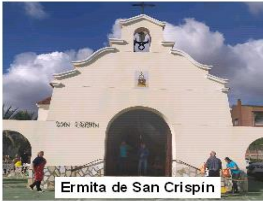
Ermita de San Crispín