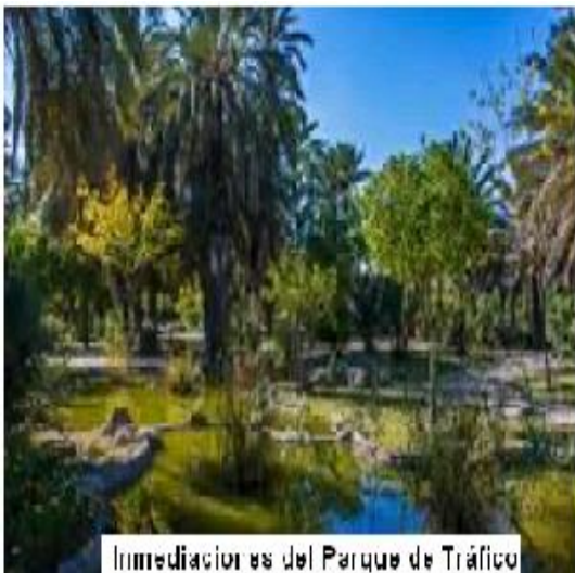
Immediaciones del Parque de Tráfico

Esta ermita dedicada al patrón de los zapateros, no está situada en este emplazamiento por casualidad en la parte norte del barrio de Carrus, este barrio que prácticamente se creó en los años 60 - 70, con edificios de planta baja o con un máximo de hasta cinco alturas en su mayor parte, es un barrio obrero y con gran parte de sus habitantes inmigrantes llegados de otros puntos de nuestra geografía, años en los que venían gentes del centro y sur de España y de poblaciones limítrofes, atraídos por la floreciente industria no