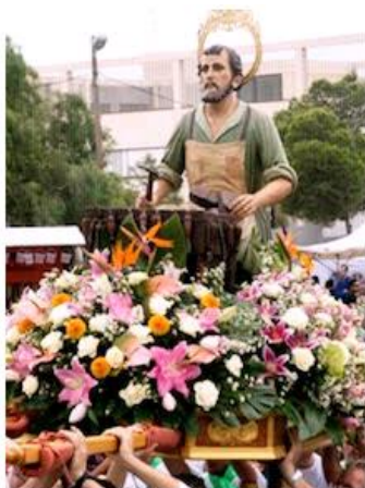
Romería de San Crispín