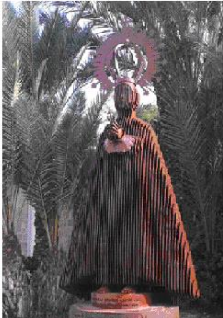
Imagen de la Virgen de la Asunción realizada en el año 2.016 por el escultor illicitano Juan Tomas Lloret con superposición de laminas de acero corten por suscripción popular promovida por la Asociación Venida de la Virgen y expuesta en el Paso de Jaca

RUTA ERMITES DEL CAMP D'ELX - José Angel Martínez Tenllado – Octubre 2023.