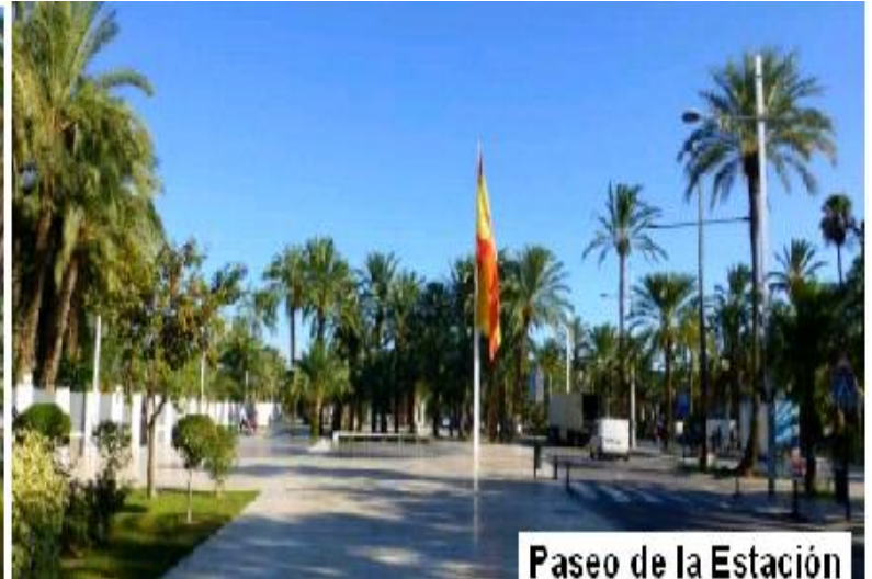
Paseo de la Estación

sólo del calzado sino por las afines a este sector, así como las relacionadas con la construcción ya que había que dar techo a esa población, así pues este era un lugar cercano para honrar al Santo, aquel Santo que les proporcionaba el pan de cada día y la posibilidad de construir una vida mejor para ellos y sus familias, un futuro.