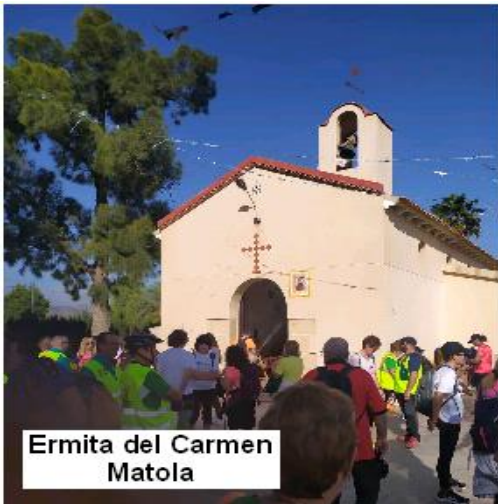
Ermita del Carmen Matola

rezos que dice: “ San Pascual Baylón, báilame en este fogón. Tú me des la sazón y, yo te dedico un dazón ”, contando la leyenda que mientras cocinaba se ponía a cantar y rezar olvidándose de lo que guisaba por lo que tenían que venir los ángeles a terminársela, habiéndose creado el Premio San Pascual Bailón de cocina. Bailón o Baylón, pese a ser