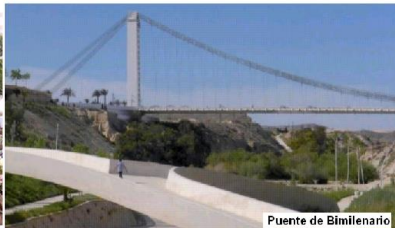
Puente de Bimilenario