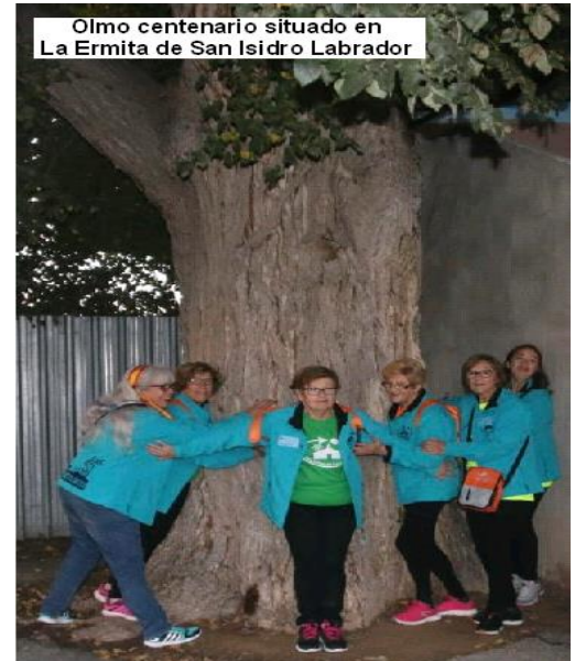
Olmo centenario situado en La Ermita de San Isidro Labrador

En este tramo en el que nos introducimos, Camino de la Argamasa, denominado así por encontrarse en el uno de los partidores de la acequia “Marchena” o “Rafa Gran”, quizás lo podemos considerar como uno