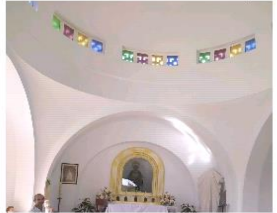
Interior de la Ermita de San Crispín