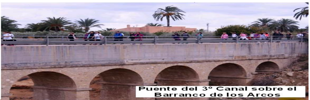
Puente del 3º Canal sobre el Barranco de los Arcos

rezos que dice: “ San Pascual Baylón, báilame en este fogón. Tú me des la sazón y, yo te dedico un dazón ”, contando la leyenda que mientras cocinaba se ponía a cantar y rezar olvidándose de lo que guisaba por lo que tenían que venir los ángeles a terminársela, habiéndose creado el Premio San Pascual Bailón de cocina. Bailón o Baylón, pese a ser